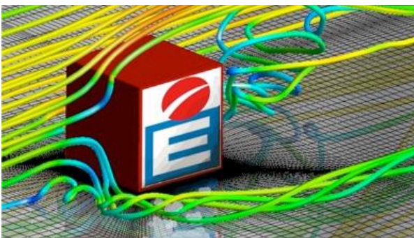
Ecoulement au passage d'un cube - fluctuations de pressions pariétales dans le sillage de l'obstacle

Ce séminaire a pour objectif de présenter quelques études numériques en mécanique des fluides réalisées par le Pôle Énergétique de l'ECAM LYON dans le cadre de projets industriels et de collaborations avec des laboratoires scientifiques.